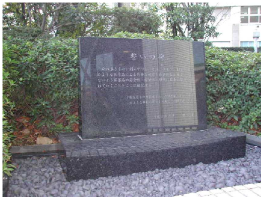
厚労省内の「誓いの碑」

薬害イレッサを解決して、薬害の連鎖を断ち切ろう！ 薬事行政を監視する第三者機関を実現させよう！