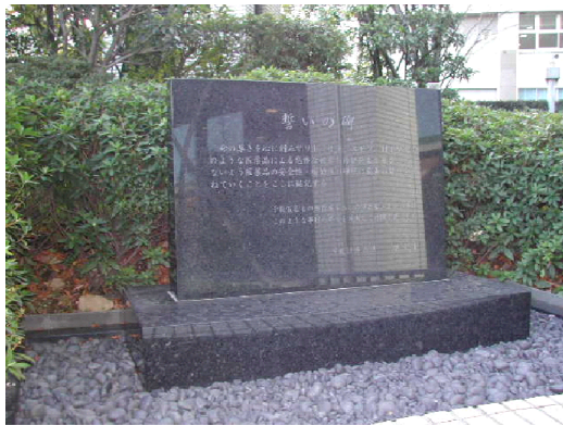
厚労省内の「誓いの碑」

薬害イレッサを解決して、薬害の連鎖を断ち切ろう！ 薬事行政を監視する第三者機関を実現させよう！