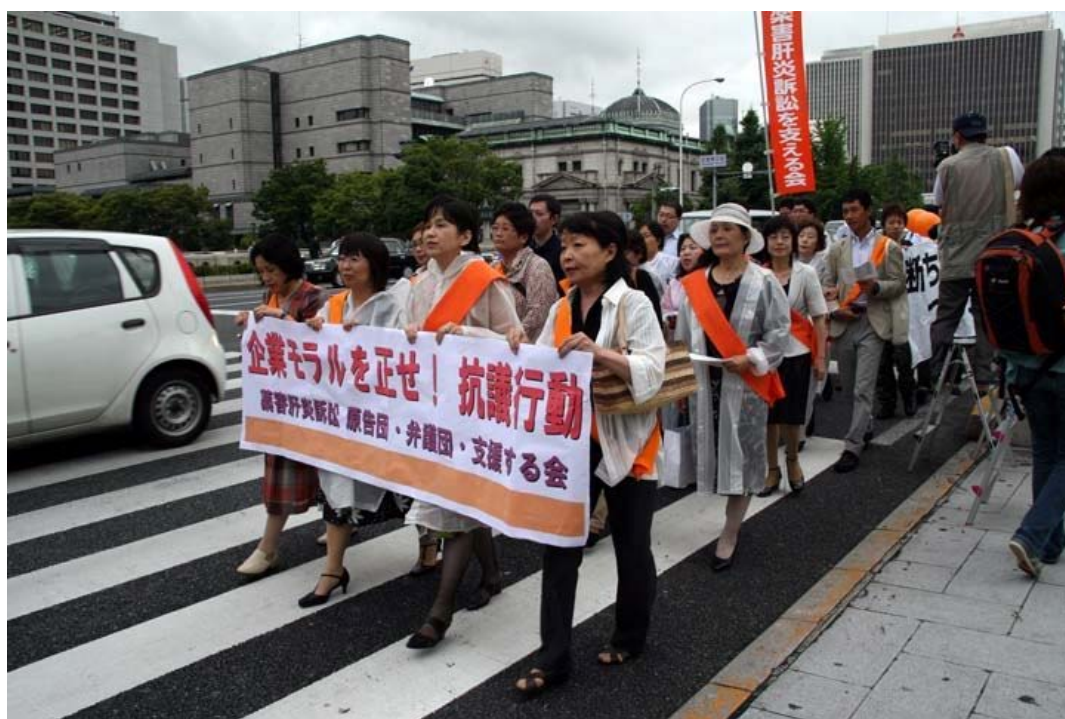
↑6月23日、「企業モラルを正せ!抗議行動の様子

〒160-0022 東京都新宿区新宿1-24 2 長井ビル3階 オアシス法律事務所 TEL: 03-5363-0138 / FAX: 03-5363-0139 / Mail: kanenshien-tokyo@hotmail.co.jp